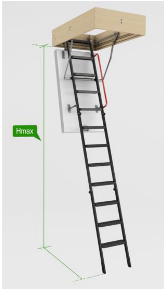
Rys. 1 Maksymalna wysokość pomieszczenia